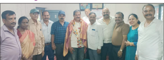
ಕನ್ನಡ ಪೋಸ್ಟ್ ನ್ಯೂಸ್ ನೆಟ್ವರ್ಕ್