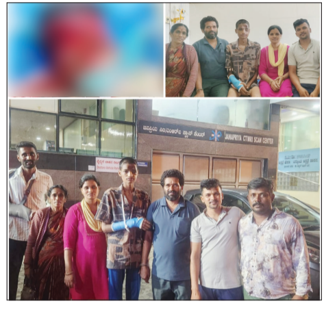
ಕಲ್ಲು-ಮಣ್ಣು ಮೆದುಳಿನ ಪದರ ಸೇರಿತ್ತು. ಹೃದಯ ಬಡಿತವೂ ನಿಂತಿದ್ದು, ನಾಡಿ ಮಿಡಿತ ಕೂಡ ಇರಲಿಲ್ಲ. ತಕ್ಷಣ ಹೃದಯಕ್ಕೆ ವಿಧಿಮಾನ್ಯ ಚಿಕಿತ್ಸೆ ನೀಡಲಾಯಿತು. ಶಸ್ತ್ರ ಚಿಕಿತ್ಸೆ ನಂತರ ಪುನರ್ಜನ್ಮ ಪಡೆದರು.