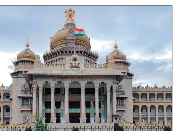
ಕನ್ನಡ ಪೋಸ್ಟ್ ನ್ಯೂಸ್ ಸೆಕ್ಷರ್

ಪ್ರಸ್ತುತ ಮೂಲ ವೇತನದ ಶೇ.14.25 ರಿಂದ ಶೇ.15.75ಕ್ಕೆ ಪರಿಷ್ಕೃತ ಮಂಜೂರು ಮಾಡಲು ನಿರ್ಧಾರ ಮಾಡಲಾಗಿದೆ. 2024ರ ಪರಿಷ್ಕೃತ ವೇತನ ಶ್ರೇಣಿಯಲ್ಲಿ ವೇತನ ಶ್ರೇಣಿಯು ಗರಿಷ್ಠಕ್ಕಿಂತ ಹೆಚ್ಚಾಗಿ ಸ್ಥಗಿತ ವೇತನ ಬಡ್ಡಿಯನ್ನು ನೀಡಲಾಗಿದ್ದರೆ, ಆ ಸ್ಥಗಿತ ವೇತನಕ್ಕೆ ಬಡ್ಡಿ ಸಿಗಲಿದೆ. ಅಥವಾ 2024ರ ಕರ್ನಾಟಕ ನಾಗರಿಕ ಸೇವಾ ನಿಯಮಗಳ ನಿಯಮ 3(ಸಿ) ಯನ್ನು ಓದಿಕೊಂಡು 7ನೇ ನಿಯಮದ (3)ನೇ ಉಪ ನಿಯಮದ ಮೇರೆಗೆ ನೀಡಲಾದ ವೈಯಕ್ತಿಕ ವೇತನ ಇದ್ದರೆ ಅದರ ಆಧಾರದಲ್ಲಿ ತುಟ್ಟ ಭತ್ಯೆ ಹೆಚ್ಚಳ ಆಗಲಿದೆ. ಜೊತೆಗೆ