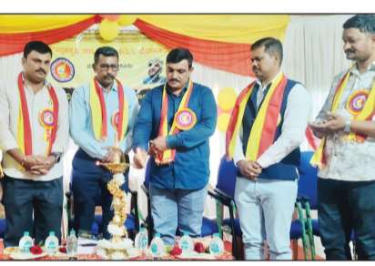
ಕನ್ನಡ ಪೋಸ್ಟ್ ನ್ಯೂಸ್ ಸೆಕ್ಷರ್

ಮೈಸೂರು : ಸರ್ಕಾರಿ ಕನ್ನಡ ಶಾಲೆಗಳು ಉಳಿಯಬೇಕಾದರೆ ಕನ್ನಡ 'ಅನ್ನದ ಭಾಷೆ'ಯಾದಾಗ ಮಾತ್ರ ಕನ್ನಡ ಶಾಲೆಗಳು ಉಳಿಯಲು ಸಾಧ್ಯ. ಕರ್ನಾಟಕದಲ್ಲಿ ಆಡಳಿತಕ್ಕೆ ಬರುವ ಯಾವುದೇ ಸರ್ಕಾರವಾದರೂ ಕನ್ನಡ ಶಾಲೆಗಳ ಉಳಿವಿನ ಕುರಿತು ರಾಜ್ಯ ಸರ್ಕಾರದ ಎಲ್ಲಾ ಇಲಾಖೆಗಳ ನೇಮಕಾತಿಗಳಲ್ಲಿ ಸರ್ಕಾರಿ ಕನ್ನಡ ಮಾಧ್ಯಮ ಶಾಲೆಗಳಲ್ಲಿ ಓದಿದ ಮಕ್ಕಳಿಗೆ ಶೇ 25 ಮೀಸಲಾತಿ ಸೌಲಭ್ಯ ಕಲ್ಪಿಸುವ ಕಾನೂನು ಜಾರಿಗೆ ಅಗತ್ಯವಿದೆ ಎಂದು ಕೇಂದ್ರ ಕನ್ನಡ ಸಾಹಿತ್ಯ ವೇದಿಕೆಯ ರಾಜ್ಯಾಧ್ಯಕ್ಷ ಕೊಟ್ಟೇಶ್ ಎಸ್. ಉಪ್ಪಾರ್ ಅವರು ಹೇಳಿದರು.