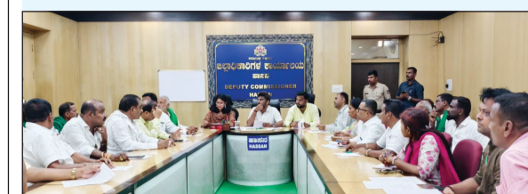
ಕನ್ನಡ ಪೋಸ್ಟ್ ನ್ಯೂಸ್ ಸೆಕ್ಷರ್

ಹಾಸನ : ಜಿಲ್ಲಾಧಿಕಾರಿ ಕಚೇರಿಯಲ್ಲಿಂದು 2026-27ನೇ ಸಾಲಿನ ಮುಂಗಾರು ಹಂಗಾಮಿನ ಆಲೂಗಡ್ಡೆ ಬೆಳೆಯ ಬಗ್ಗೆ ಉಲ್ಲೇಖಿತ ಆಲೂಗಡ್ಡೆ, ಜಿಲ್ಲಾ, ಸಲಹಾ ಸಮಿತಿ ಸಭೆ ನಡೆಯಿತು.