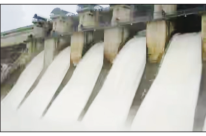
ಕನ್ನಡ ಪೋಸ್ಟ್ ನ್ಯೂಸ್ ಸೆಕ್ಷರ್

ನಾಲಾ ವ್ಯಾಪ್ತಿಯ ಸಾರ್ವಜನಿಕರು ಎಚ್ಚರವಹಿಸಲು ಸೂಚನೆ