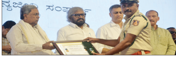
ಕನ್ನಡ ಪೋಸ್ಟ್ ನ್ಯೂಸ್ ನೆಟ್ವರ್ಕ್