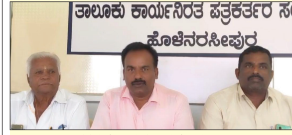
ತಾಲೂಕು ಕಾರ್ಯನಿರತ ಪತ್ರಕರ್ತರ ಸಂಘದ ಹೊಳೆನರಸೀಪುರ