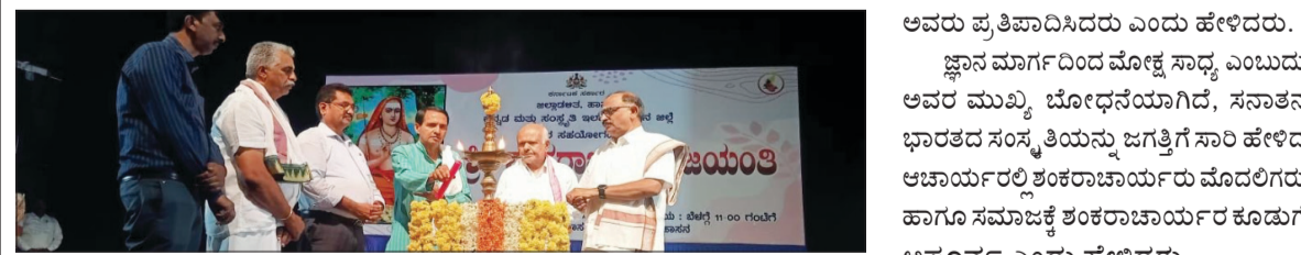
ಕನ್ನಡ ಪೋಸ್ಟ್ ನ್ಯೂಸ್ ನೆಟ್ವರ್ಕ್