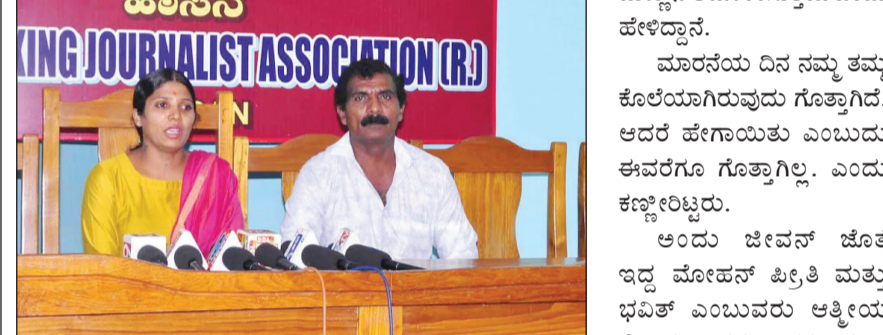
ಕನ್ನಡ ಪೋಸ್ಟ್ ನ್ಯೂಸ್ ನೆಟ್ವರ್ಕ್