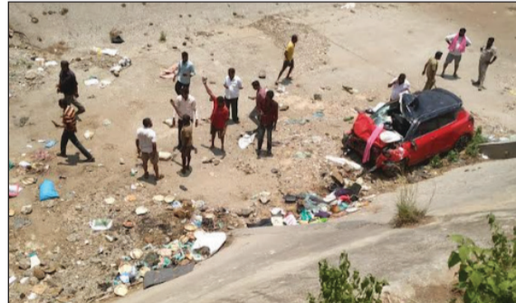
ಕನ್ನಡ ಪೋಸ್ಟ್ ನ್ಯೂಸ್ ನೆಟ್ವರ್ಕ್