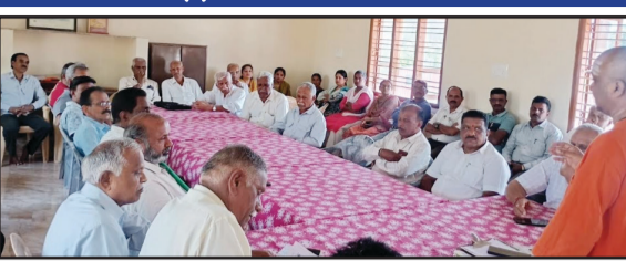
ಕನ್ನಡ ಪೋಸ್ಟ್ ನ್ಯೂಸ್ ನೆಟ್ವರ್ಕ್