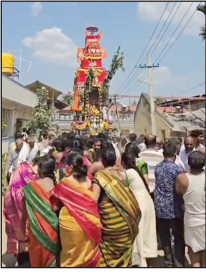
ದೇವಾಲಯದಲ್ಲಿ ಸೂರ್ಯಮಂಡಲೋತ್ಸವ, ಬಲಿ ಪ್ರದಾನ, ನಿತ್ಯೋತ್ಸವ, ಯಾತ್ರಾದಾನ ಪೂರ್ವ ಕೃಷ್ಣ

ರಥೋತ್ಸವದ ಪೂರ್ವಭಾವಿಯಾಗಿ ಪಟ್ಟಾಭಿರಾಮಸ್ವಾಮಿಯ ಮೂಲ ಮೂರ್ತಿಗೆ ಪಂಚಾಮೃತ ಅಭಿಷೇಕ, ವಿವಿಧ ಹೋಮ, ಧ್ವಜಾರೋಹಣ, ನಿತ್ಯೋತ್ಸವ, ಹಂಸಾಹನೋತ್ಸವ, ಶೇಷವಾಹನೋತ್ಸವ, ಪುಷ್ಪಮಂಟಪೋತ್ಸವ, ಸಿಂಹವಾಹನೋತ್ಸವ, ಗಜವಾಹನೋತ್ಸವ, ಸೀತಾರಾಮ ಕಲ್ಯಾಣೋತ್ಸವ ಮುಂತಾದ ಧಾರ್ಮಿಕ ಕೈಂಕರ್ಯಗಳು ವಿಧಿವತ್ತಾಗಿ ಜರುಗಿದವು. ರಥೋತ್ಸವ ಅಂಗವಾಗಿ