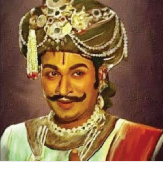
ಅವರ ಅಭಿನಯ...ಅವರು ಕಟ್ಟಿಕೊಟ್ಟ ಮೌಲ್ಯಗಳು ಇಂದಿಗೂ ಕನ್ನಡಿಗರ ಹೃದಯದಲ್ಲಿ ಜೀವಂತವಾಗಿದ್ದು, ಕರ್ನಾಟಕದ ಅಸ್ಮಿತೆಯನ್ನು ಶಾಶ್ವತವಾಗಿ ಬೆಳೆಸುತ್ತಿವೆ.