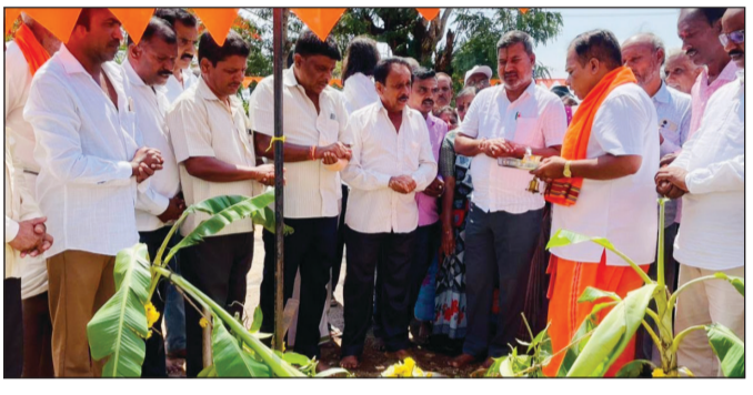
ಕನ್ನಡ ಪೋಸ್ಟ್ ನ್ಯೂಸ್ ನೆಟ್ವರ್ಕ್