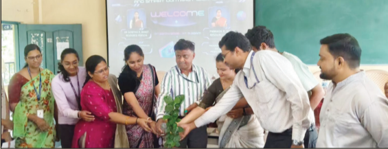
ಕನ್ನಡ ಪೋಸ್ಟ್ ನ್ಯೂಸ್ ನೆಟ್ವರ್ಕ್

ಹಾಸನ: ನಗರದ ಮಲೆನಾಡು ತಾಂತ್ರಿಕ ಮಹಾವಿದ್ಯಾಲಯದಲ್ಲಿ ಕಂಪ್ಯೂಟರ್ ಸೈನ್ಸ್ ಅಂಡ್ ಬ್ಯುಸಿನೆಸ್ ಸಿಸ್ಟಮ್ಸ್ ವಿಭಾಗದಿಂದ ಬುಧವಾರ ಸುಧಾರಿತ ವಿಕೇಂದ್ರೀಕೃತ ಅಪ್ಲಿಕೇಶನ್ ಮತ್ತು ಸ್ಮಾರ್ಟ್ ಕಾಂಟ್ರಾಕ್ಟ್ ಗಳ ಕುರಿತು ಒಂದು ದಿನದ ಕಾರ್ಯಾಗಾರ ಹಮ್ಮಿಕೊಳ್ಳಲಾಗಿತ್ತು.