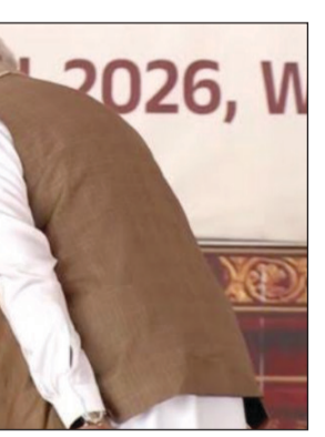
ಕನ್ನಡ ಪೋಸ್ಟ್ ನ್ಯೂಸ್ ನೆಟ್ವರ್ಕ್ ಹಾಸನ: ಡಿ ಎಚ್ ಎಸ್, ಎಸ್ ಎಫ್ ಐ, ಡಿ ಎಚ್ ಎಫ್ ಐ, ಬಿಜಿಎಫ್, ಸಿಟಿಯು, ಜಿಎಂಎಸ್, ಕೆ.ಪಿ.ಆರ್.ಎಸ್ ಸಂಘಟನೆಗಳ ಆಶ್ರಯದಲ್ಲಿ ಡಾ. ಬಿ.ಆರ್. ಅಂಬೇಡ್ಕರ್ 135ನೇ ಜಯಂತಿ ಅಂಗವಾಗಿ ಅಂಬೇಡ್ಕರ್ ಅವರ ಜಾತಿ ವಿನಾಶ ಕೃತಿಯ ಸಾಮೂಹಿಕ ಓದು ಮತ್ತು ಸಮಕಾಲೀನ ವಿಶ್ಲೇಷಣೆಯನ್ನು ನಗರದ ಆರ್.ಸಿ ರಸ್ತೆಯಲ್ಲಿರುವ ಶ್ರಮ ಕಚೇರಿಯಲ್ಲಿ ನಡೆಯಿತು.

ದೇವೇಗೌಡರ ಕೈ ಹಿಡಿದುಕೊಂಡು ಕೆಲಹೊತ್ತು ಮಾತುಕತೆ ನಡೆಸಿದ್ದು ವಿಶೇಷವಾಗಿತ್ತು. ಇನ್ನು ಭಾಷಣದಲ್ಲೂ ದೇವೇಗೌಡರನ್ನು ಹಾಡಿಹೊಗಳಿದ ಮೋದಿ, ಇಡೀ ವಿಶ್ವಕ್ಕೆ ರಾಗಿ ಮುದ್ದೆ ಪರಿಚಯಿಸಿದ ಕೀರ್ತಿ ಅವರಿಗೆ ಸಲ್ಲುತ್ತದೆ. ಹೀಗಾಗಿ ಯುವಕರು ಹೆಚ್ಚು ಹೆಚ್ಚು ರಾಗಿ ಮುದ್ದೆಯನ್ನು ಸೇವಿಸಲು ಕರೆಕೊಟ್ಟರು.