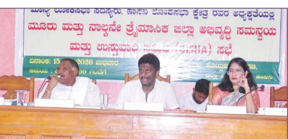
ಹಾಸನ: ಜಿಲ್ಲೆಯಲ್ಲಿ ಜಲ ಜೀವನ ಮಿಷನ್ (ಜೆಜಿಎಂ) ಅಡಿ ಕಾಮಗಾರಿ ಸಂಯೋಗ ಅನುಷ್ಠಾನ ಆಗದೇ ಇರುವುದಕ್ಕೆ ಸಂಸದ ಶ್ರೀಯಸ್ ಎಂ. ಪಟೇಲ್ ತೀವ್ರ ಅಸಮಾಧಾನ ವ್ಯಕ್ತಪಡಿಸಿದರು.

ಕನ್ನಡ ಪೋಸ್ಟ್ ನ್ಯೂಸ್ ನೆಟ್ವರ್ಕ್ ಹಾಸನ: ಜಿಲ್ಲೆಯಲ್ಲಿ ಜಲ ಜೀವನ ಮಿಷನ್ (ಜೆಜಿಎಂ) ಅಡಿ ಕಾಮಗಾರಿ ಸಂಯೋಗ ಅನುಷ್ಠಾನ ಆಗದೇ ಇರುವುದಕ್ಕೆ ಸಂಸದ ಶ್ರೀಯಸ್ ಎಂ. ಪಟೇಲ್ ತೀವ್ರ ಅಸಮಾಧಾನ ವ್ಯಕ್ತಪಡಿಸಿದರು.