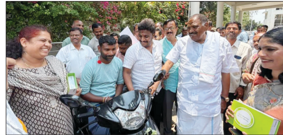
ಕನ್ನಡ ಪೋಸ್ಟ್ ನ್ಯೂಸ್ ನೆಟ್ವರ್ಕ್