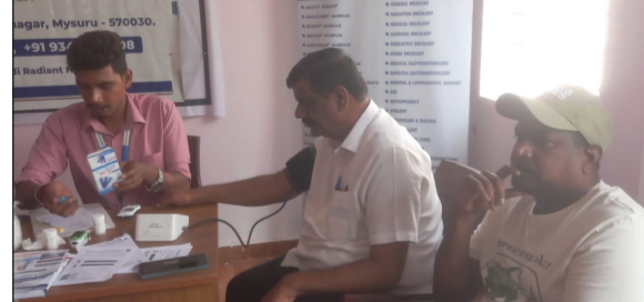
ಕನ್ನಡ ಪೋಸ್ಟ್ ನ್ಯೂಸ್ ನೆಟ್ವರ್ಕ್

ಹಾಸನ: ನಗರದ ಜಿಲ್ಲಾ ಕಾರ್ಯನಿರತ ಪತ್ರಕರ್ತರ ಭವನದಲ್ಲಿ ಮೈಸೂರಿನ ಕ್ವಿಯರ್ ಮೆಡೀ ರೇಡಿಯಂಟ್ ಹಾಸ್ಪಿಟಲ್ ವತಿಯಿಂದ ಇಂದು ಹಮ್ಮಿಕೊಂಡಿದ್ದ ಉಚಿತ ಆರೋಗ್ಯ ತಪಾಸಣಾ ಶಿಬಿರ ಯಶಸ್ವಿಯಾಯಿತು. ನಗರ ಹಾಗೂ ಜಿಲ್ಲೆಯ ವಿವಿಧ ತಾಲೂಕುಗಳಿಂದ ಆಗಮಿಸಿದ್ದ ನೂರಾರು ಪತ್ರಕರ್ತರು ಹಾಗೂ ಮಹಿಳೆಯರು, ಹಿರಿಯರು ಸೇರಿದಂತೆ ಅವರ ಕುಟುಂಬ ಸದಸ್ಯರು, ಬೆಳಗ್ಗೆಯಿಂದ ಸಂಜೆವರೆಗೂ ತಮ್ಮ ವಿವಿಧ ಆರೋಗ್ಯ ಸಮಸ್ಯೆಗಳ ಬಗ್ಗೆ ವೈದ್ಯರನ್ನು ಭೇಟಿ ಮಾಡಿ ಅವರಿಂದ ಸಲಹೆ ಸೂಚನೆ ಪಡೆದರು. ಹೆಚ್ಚಾಗಿ ಜಿಬಿಆರ್‌ಎಸ್ (ಬ್ಲಡ್ ಶುಗರ್ ಟೆಸ್ಟ್), ಬ್ಲಡ್ ಪ್ರೆಶರ್ ಪರಿಶೀಲನೆ, ತೂಕ ಅಳತೆ, ಟೆಂಪರೇಚರ್ ಚೆಕ್‌ಪ್, ಏಪಿಫ್‌ಟಿ (ಪೆಲ್ಯೂನರಿ ಫಂಕ್ಷನ್ ಟೆಸ್ಟ್), ಬಿಎಂಡಿ (ಬೋನ್ ಮಿನರಲ್ ಡೆನ್ಸಿಟಿ ಟೆಸ್ಟ್) ಪರೀಕ್ಷೆಯನ್ನು ಹೆಚ್ಚಾಗಿ ಮಾಡಿಸಿಕೊಂಡರು.