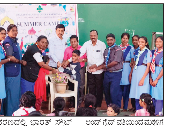
ಆವರಣದಲ್ಲಿ ಭಾರತ್ ಸೌಟ್ ಅಂಡ್ ಗೈಡ್ಸ್ ವತಿಯಿಂದ ಮಕ್ಕಳಿಗೆ