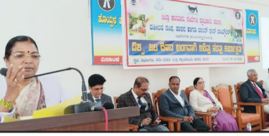
ಉಳಿಸಬಹುದು. ಹಾಗಾಗಿ ಮನುಷ್ಯ ತಾನು ಬದುಕುವುದರ ಜೊತೆಗೆ ಪ್ರಾಣಿ-ಪಕ್ಷಿಗಳಿಗೂ ಕೂಡ ನೀರು ಉಳಿಸಿ