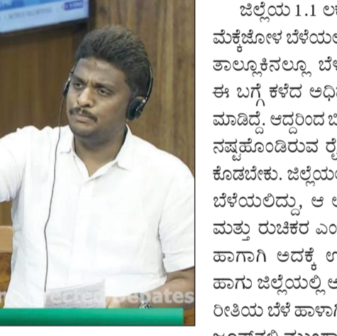
ಕೃಷಿ ಹಾಗೂ ತೋಟಗಾರಿಕೆ ಬೆಳೆಗಳಿಗೆ ಸೂಕ್ತ ಪರಿಹಾರ ನೀಡುವಂತೆ ಇದೇ ವೇಳೆ ಸರ್ಕಾರವನ್ನು ಆಗ್ರಹಿಸಿದರು.