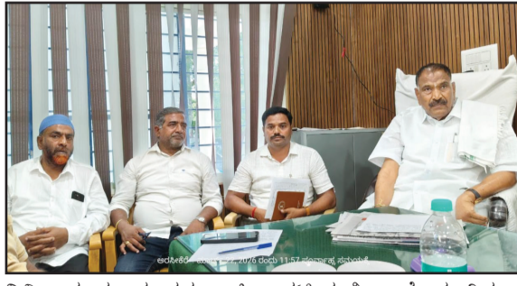
ನಿರ್ಮಿಸುವ ಮಹತ್ವಕಾಂಕ್ಷಿ ಯೋಜನೆಯಲ್ಲಿ ಮೊದಲ ಹಂತವಾಗಿ 328 ಮನೆಗಳು ಪೂರ್ಣಗೊಂಡಿವೆ.