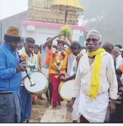
ಹೊಗಳಿಕೆ ಹಾಡಿನೊಂದಿಗೆ ಶನಿವಾರ ಬೆಳಿಗ್ಗೆ 7ಕ್ಕೆ