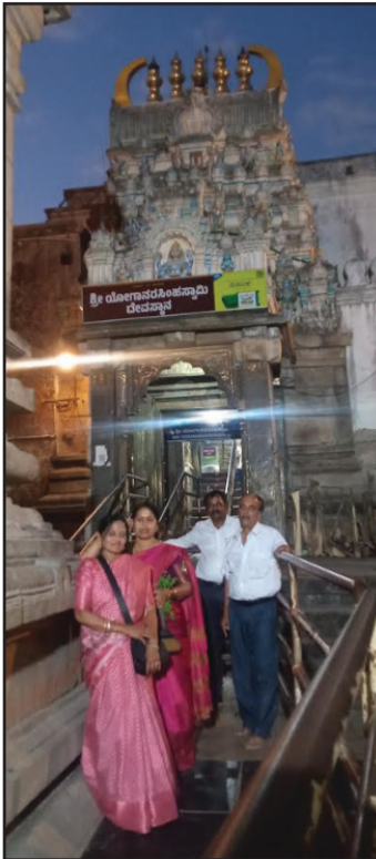
ಮೂರು ಕ್ಷೇತ್ರಗಳು ಕಂಚಿ, ತಿರುಪತಿ ಮತ್ತು ಶಿಲ್ಪ ರಂಗಂ. ಕೃತಯುಗದಲ್ಲಿ ಸನತ್ಕುಮಾರ ಇಲ್ಲಿ ತಿರುನಾರಾಯಣ ಮೂರ್ತಿಯನ್ನು ಪ್ರತಿಷ್ಠಾಪಿಸಿ ನಾರಾಯಣಾದಿ, ಎಂದೂ, ತೇಲ ತಾಯಿಗದಲ್ಲಿ ದತ್ತಾತ್ರೇಯರು ಈ ಪರ್ವತದಲ್ಲಿ ವೇದ ಪಾರಾಯಣ ಮಾಡಿ ವೇದಾದಿಯೆಂದೂ, ದ್ವಾಪರದಲ್ಲಿ ಶ್ರೀಕೃಷ್ಣನಿಂದ ಪೂಜಿಸಲ್ಪಟ್ಟ ಯಾದವಾದಿಯೆಂದೂ,

12ನೇ ಶತಮಾನದಲ್ಲಿ ಶಿಲ್ಪ ರಾಮಾನುಜಾಚಾರ್ಯರು ನೆಲೆಸಿದ್ದ ಮೇಲುಕೋಟೆ ಸ್ಥಳವು ಚಿಲುವನಾರಾಯಣಸ್ವಾಮಿ ದೇವಾಲಯ, ಯೋಗನರಸಿಂಹಸ್ವಾಮಿ ದೇವಾಲಯ, ಕಲ್ಯಾಣಿ ಮತ್ತು ವೈರಮುಡಿ ಉತ್ತಮ ಕೆಲಸಗಳಿಗೆ 3589 ಅಡಿ ಎತ್ತರದ ಯದುಗಿರಿ ಬೆಟ್ಟದ ಮೇಲಿರುವ ಇದು ರಾಯಗೋಪುರ, ಪಂಚಕಲ್ಯಾಣಿ, ಅಕ್ಷತಂಗಿಯರ ಕೋಟೆ, ಧನುಷ್ಕೋಟಿ ಇರುವ ಧಾರ್ಮಿಕ ಕ್ಷೇತ್ರ. ಮೇಲುಕೋಟೆಗೆ ಯಾದವಾದಿ, ವೇದಾದಿ, ನಾರಾಯಣಾದಿ, ಯತಿಶೈಲಿ, ಯದುಗಿರಿ ಎಂಬ ಹೆಸರುಗಳಿವೆ. ಶಾಸನಗಳಲ್ಲಿ ಯಾದವರಿಗೆ ಯದುಗಿರಿ, ವೈಕುಂಠವರ್ಧನ ಕ್ಷೇತ್ರ, ದಕ್ಷಿಣ ಬದರಕಲ್ಯಾಣ, ತಿರುನಾರಾಯಣಪುರ, ಮೇಲುಕೋಟೆ ಹೆಸರಿನ ಉಲ್ಲೇಖವಿದೆ. 1189ರಲ್ಲಿ ಕೋಟೆ ಇದ್ದ ಬಗ್ಗೆ ಆಧಾರಗಳು ದೊರೆತಿವೆ. ಹೋಬಳಿ ಕೇಂದ್ರವಾದ ಇದು ಹೊಯ್ಸಳರ ವಿಷ್ಣುವರ್ಧನ (ಕ್ರಿ.ಶ.1008-1148) ಕಾಲದಿಂದ ಮೈಸೂರು ಅರಸರ ಕಾಲದವರೆಗೆ ರಾಜಾಶ್ರಯ ಪಡೆದಿತ್ತು. ಶಿಲ್ಪ ರಾಮಾನುಜಾಚಾರ್ಯರು ಈ ಸ್ಥಳಕ್ಕೆ ಬರುವ ಮೊದಲೇ ಇಲ್ಲಿ ಚಿಲುವನಾರಾಯಣಸ್ವಾಮಿ ಮತ್ತು ಯೋಗನರಸಿಂಹಸ್ವಾಮಿ ದೇವಸ್ಥಾನಗಳಿದ್ದವು. ಶಿಲ್ಪ ರಾಮಾನುಜಾಚಾರ್ಯರು 14 ವರ್ಷ ಇಲ್ಲಿ ವಾಸಿಸುತ್ತಿದ್ದರಾಗಿ ಇದು ಬ್ರಾಹ್ಮಣರ ಶಿಲ್ಪ ವೈಷ್ಣವ ಪಂಥದ ಪ್ರಮುಖ ಕೇಂದ್ರವಾಯಿತು. ದಕ್ಷಿಣ ಭಾರತದಲ್ಲಿ ಶಿಲ್ಪ ವೈಷ್ಣವ ಕ್ಷೇತ್ರಗಳೆಂದು ಖ್ಯಾತವಾಗಿರುವ ನಾಲ್ಕು ಮಣ್ಣು ಕ್ಷೇತ್ರಗಳ ಪೈಕಿ ಮೇಲುಕೋಟೆಯೂ ಒಂದು. ಇನ್ನೊಂದು