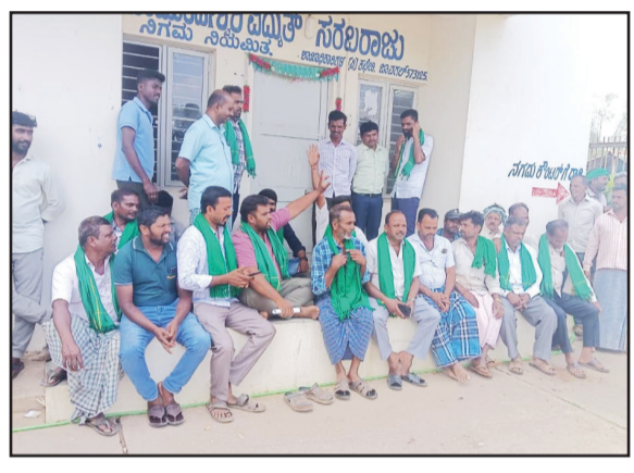
ಒಳಮೀಸಲಾತಿ ಪರಿಶೀಲನೆಗೆ ಆಗ್ರಹ