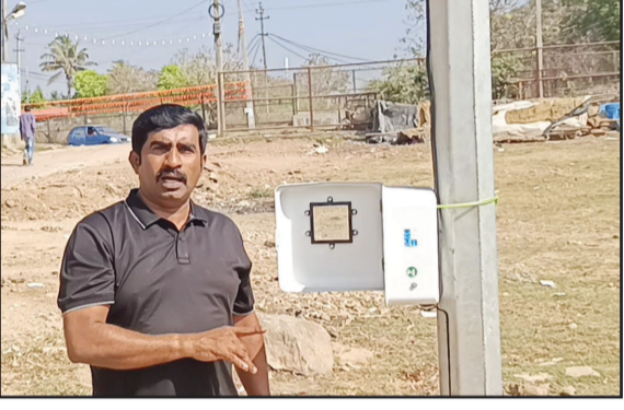
ಪುರಸಭೆ ನಿಧಿಯಿಂದ ಜನರ ಅನುಕೂಲಕ್ಕಾಗಿ ಕಾಮಗಾರಿ ಮಾಡಲಾಗುತ್ತದೆ.

ರಾತ್ರಿ 10 ಗಂಟೆವರೆಗೂ ನಡೆಯುವ ಸಂತೆಯಲ್ಲಿ ಬೆಳಿಗ್ಗೆನ ಕೊರತೆ ಕಂಡು ಬರುತ್ತಿರುವುದು ದುರಂತಕರ ಎಂದು ಅವರು ಆರೋಪಿಸಿದರು.