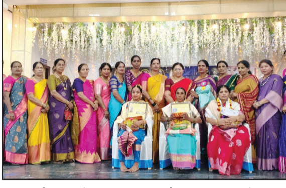
ವಿವಿಧ ಕ್ಷೇತ್ರಗಳಲ್ಲಿ ಮಹತ್ತರ ಸಾಧನೆ ಮಾಡಿರುವವರನ್ನು ನಾವು ನೆನೆಯುತ್ತೇವೆ. ಆ ಸಾಧನೆಗಳನ್ನು ಕೇವಲ ನೆನಪಿಸಿಕೊಳ್ಳುವುದಷ್ಟೇ ಅಲ್ಲದೆ, ಅವುಗಳಿಂದ ಪ್ರೇರಣೆ ಪಡೆದು ಜೀವನದಲ್ಲಿ ಅನುಸರಿಸಿ ಸುಖ ಸಂಸಾರದಲ್ಲಿ ಮುನ್ನಡೆಯಬೇಕು ಎಂಬುದನ್ನು ಮಹಿಳಾ ದಿನಾಚರಣೆ ನಮಗೆ ಕಲಿಸುತ್ತದೆ ಎಂದು ಹೇಳಿದರು.