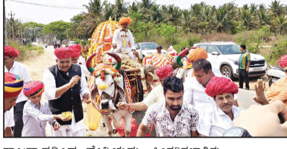
ಕನ್ನಡ ಪೋಸ್ಟ್ ನ್ಯೂಸ್ ನೆಟ್ವರ್ಕ್

ಚನ್ನರಾಯಪಟ್ಟಣ: ತಾಲೂಕಿನ ಹಿರೀಸಾವೆಯಲ್ಲಿ ಸಿರವಿ ಸಮಾಜದ ವತಿಯಿಂದ ಶ್ರೀ ಆಯಿ ಮಾತಾ (ಶ್ರೀ ಚಾಮುಂಡೇಶ್ವರಿ ಅವತಾರ) ದೇವಿಯ ಎತ್ತಿನ ಬಂದಿ ಉತ್ಸವ ಹಾಗೂ ವಿಶೇಷ ಪೂಜೆ ಶನಿವಾರ ವಿಜೃಂಭಣೆಯಿಂದ ನಡೆಯಿತು. ನೂರಾರು ವರ್ಷಗಳ ಹಿಂದೆಯೇ ರಾಜಸ್ಥಾನ ರಾಜ್ಯದ ಜೋಡುಪುರ ಜಿಲ್ಲೆಯ ಬಿಲ್ಲಾಡ ಗ್ರಾಮದಿಂದ ಆಗಮಿಸಿ ತಾಲೂಕಿನ ಹಿರೀಸಾವೆ ಗ್ರಾಮದಲ್ಲಿ ಸಿರವಿ ಸಮುದಾಯದ 17 ಕುಟುಂಬಗಳು ನೆಲೆಸಿದ್ದು ಗ್ರಾಮದೇವತೆ ಶ್ರೀ ಆಯಿ ಮಾತಾ ದೇವಿಯನ್ನು ಇಲ್ಲಿಗೆ ಇದೇ ಮೊದಲ ಬಾರಿಗೆ ಕರೆತಂದಿರುವುದು ವಿಶೇಷವಾಗಿದೆ. 1,850 ಕಿಮೀ ದೂರದ