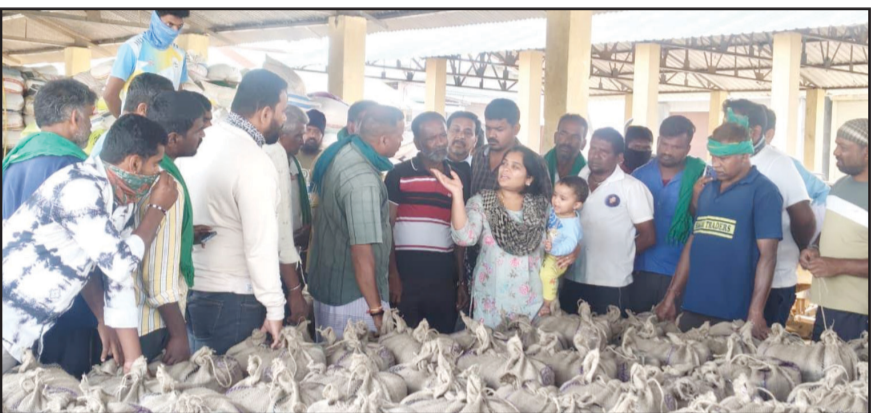
ಕನ್ನಡ ಪೋಸ್ಟ್ ನ್ಯೂಸ್ ನೆಟ್ವರ್ಕ್