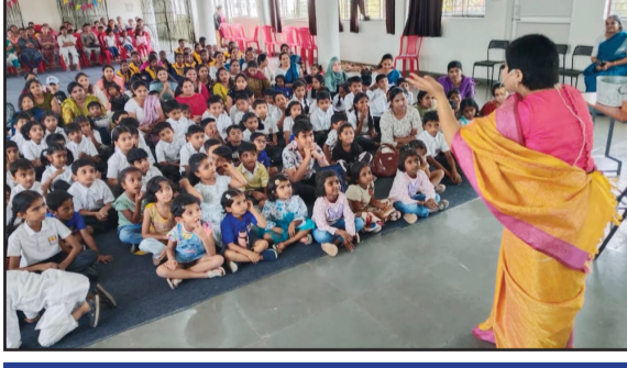
ಕನ್ನಡ ಪೋಸ್ಟ್ ನ್ಯೂಸ್ ನೆಟ್ವರ್ಕ್