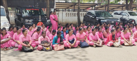
ಕನ್ನಡ ಪೋಸ್ಟ್ ನ್ಯೂಸ್ ನೆಟ್ವರ್ಕ್

ಹಾಸನ: ರಾಜ್ಯ ಸರ್ಕಾರ ಕೊಟ್ಟ ಮಾತಿಂತೆ ಆಶಾ ಕಾರ್ಯಕರ್ತರಿಗೆ ಕನಿಷ್ಠ 10 ಸಾವಿರ ರೂ. ಗೌರವದ ಸಂದರ್ಶನ ಜಾರಿಗೊಳಿಸಬೇಕೆಂದು ಆಗ್ರಹಿಸಿ ಶುಕ್ರವಾರ ಜಿಲ್ಲಾಧಿಕಾರಿ ಕಚೇರಿ ಎದುರು ರಾಜ್ಯ ಸಂಯುಕ್ತ ಆಶಾ ಕಾರ್ಯಕರ್ತೆಯರ ಸಂಘದಿಂದ ಪ್ರತಿಭಟನೆ ನಡೆಸಲಾಯಿತು. 2025 ರ ಜನವರಿ 7 ರಿಂದ 10 ರ ವರೆಗೆ ನಡೆದ ಅಹೋರಾತ್ರಿ ಧರಣಿ ಸಂದರ್ಭದಲ್ಲಿ ಹೋರಾಟಗಾರರ ಸಭೆ ನಡೆಸಿದ್ದ ಮುಖ್ಯಮಂತ್ರಿ ಸಿದ್ದರಾಮಯ್ಯ ಅವರು ಬೇಡಿಕೆ ಈಡೇರಿಕೆಗೆ ಸಮ್ಮತಿಸಿದ್ದರು. ಆದರೆ ಆ ವರ್ಷದ ಬಜೆಟ್‌ನಲ್ಲಿ ಯಾವ ನಿರ್ಧಾರವನ್ನು ಪ್ರಕಟಿಸಲಿಲ್ಲ. ಚುನಾವಣೆ ಪ್ರಕಾಶಕೆಯಲ್ಲಿ ಆಶಾ ಕಾರ್ಯಕರ್ತೆಯರ ಗೌರವ ಧನವನ್ನು 5 ರಿಂದ 8 ಸಾವಿರ ರೂ.ಗೆ ಹೆಚ್ಚಿಸುವ ಭರವಸೆ ನೀಡಲಾಗಿತ್ತು ಆದರೆ ಇದುವರೆಗೆ ಈಡೇರಿಲ್ಲ ಎಂದು ಆರೋಪಿಸಿದರು. ಇಲ್ಲಿನಲ್ಲಿ ನೆನಪಿಟ್ಟುಕೊಳ್ಳಿ ಆಶಾ ಕಾರ್ಯಕರ್ತೆಯರನ್ನು ಕೆಲಸದಿಂದ ತೆಗೆದು ಹಾಕುವ ಅಪವಿಜ್ಞಾನಿಕ ನಿರ್ಧಾರಕ್ಕೆ ಸರ್ಕಾರ ಮುಂದಾಗಿದೆ. ಕೆಲಸದಿಂದ ಕೆಲವು ಆಶಾಕಾರ್ಯಕರ್ತೆಯರನ್ನು ಗೃಹಾಂತರಿಸಿ ಕೆಲಸ ಕೊಡಿಸುವ ಭರವಸೆ ನೀಡಲಾಗಿತ್ತು ಆದರೆ ಸರ್ಕಾರ ಯಾವುದೇ ಕ್ರಮ ಕೈಗೊಂಡಿಲ್ಲ. ಪ್ರತಿ ಹಂತದಲ್ಲೂ ಆಶಾ ಕಾರ್ಯಕರ್ತೆಯರನ್ನು ಸರ್ಕಾರ ಕಡೆಗಣಿಸುತ್ತಲೇ ಬಂದಿದೆ ಎಂದು ಆಕ್ರೋಶ ವ್ಯಕ್ತಪಡಿಸಿದರು.