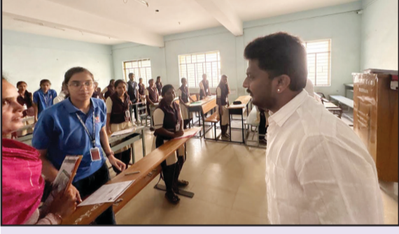
ಕನ್ನಡ ಪೋಸ್ಟ್ ನ್ಯೂಸ್ ನೆಟ್ವರ್ಕ್