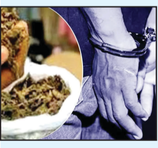
ಕನ್ನಡ ಪೋಸ್ಟ್ ನ್ಯೂಸ್ ನೆಟ್ವರ್ಕ್