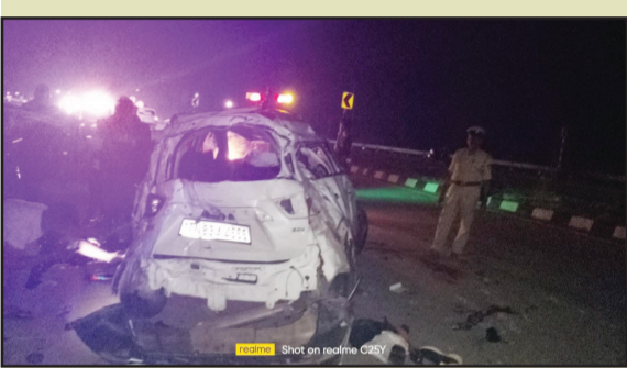
ಕನ್ನಡ ಪೋಸ್ಟ್ ನ್ಯೂಸ್ ನೆಟ್ವರ್ಕ್