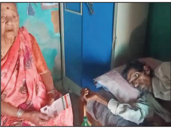
ಕನ್ನಡ ಪೋಸ್ಟ್ ನ್ಯೂಸ್ ನೆಟ್ವರ್ಕ್