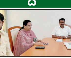
ಕನ್ನಡ ಪೋಸ್ಟ್ ನ್ಯೂಸ್ ನೆಟ್ವರ್ಕ್