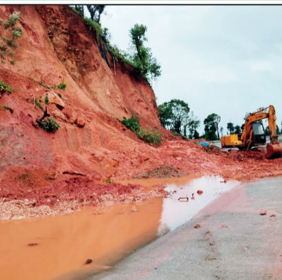
ಗ್ರಾಮದಲ್ಲಿ ರಸ್ತೆಗೆ ಮರ ಬಿದ್ದು ಸಂಚಾರಕ್ಕೆ ಕೆಲಕಾಲ ಅಡ್ಡಿಯಾಯಿತು.