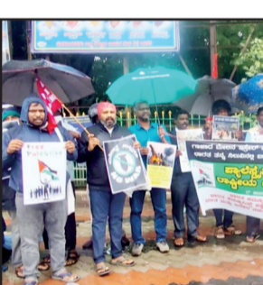
ಕನ್ನಡ ಪೋಸ್ಟ್ ನ್ಯೂಸ್ ನೆಟ್ವರ್ಕ್