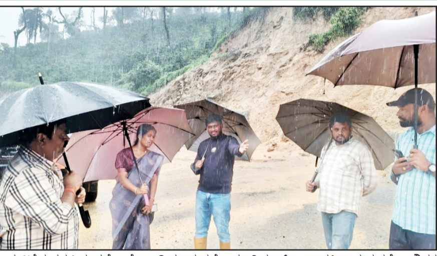
ಅರ್ಭಟಕ್ಕೆ ಗುಡ್ಡ ಕುಸಿಯುತ್ತಲೇ ಇದೆ. ಮಣ್ಣಿನ ಜೊತೆ ಮರ, ಗಿಡಗಳು ರಸ್ತೆಗೆ ಉರುಳುತ್ತಿವೆ.